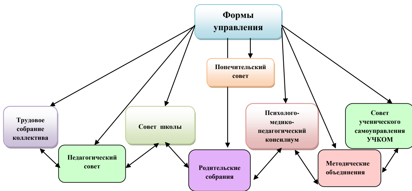
Система управления школой-интернатом

Управление системы работ осуществляется согласно Устава принятого общим собранием трудового коллектива, объединяющее всех работников, собирается не реже 2 раза в год. Уставом определено, что высшим органом управления учреждения является совет школы, который избирается на общем собрании в составе 8 человек сроком на два года, созывается совет не реже 2 раз в год. Решение педагогических и методических проблем находится в компетенции педагогического совета, который проводится не реже 4 раз в год. Органом оперативного управления учебно-воспитательным процессом в учреждении является совещание при директоре. Общее руководство осуществляет директор, у которого есть заместители. В целях координации методической работы в учреждении создаются методические объединения учителей и воспитателей. В течение учебного года проводится не менее 4 заседаний. Коллектив школы свою деятельность осуществляет в тесном взаимодействии с общественностью, родителями, лицами их заменяющими. В учреждении действует профсоюзная организация.