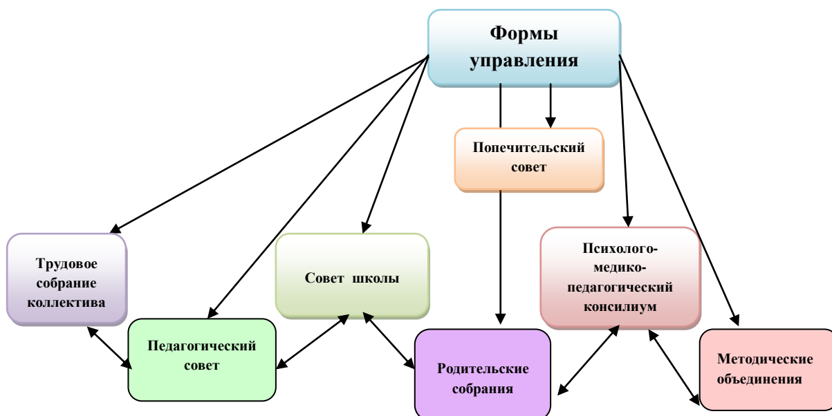
Система управления школой-интернатом

Управление системы работ осуществляется согласно Устава принятого общим собранием трудового коллектива, объединяющее всех работников, собирается не реже 4 раз в год. Уставом определено, что высшим органом управления учреждения является совет школы, который избирается на общем собрании в составе 8 человек сроком на два года, созывается совет не реже 4 раз в год. Решение педагогических и методических проблем находится в компетенции педагогического совета, который проводится не реже 4 раз в год. Органом оперативного управления учебно-воспитательным процессом в учреждении является совещание при директоре. Общее руководство осуществляет директор, у которого есть заместители. В целях координации методической работы в учреждении создаются методические объединения учителей и воспитателей. В течение учебного года проводится не менее 4 заседаний. Коллектив школы свою деятельность осуществляет в тесном взаимодействии с общественностью, родителями, лицами их заменяющими. В учреждении действует профсоюзная организация.